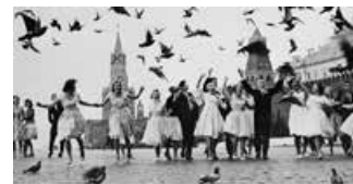
O Sesc, integrado ao Sistema Focorente MG, curadoria para a abertura da